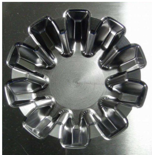
Work piece :HSG Gear Die Material :SKD61(HRC50) Dimension :100*100*60(mm) Cutting tool: Carbide endmill & CBN endmill Cutting oil : Oil mist Cutting time : 1hrs 50min