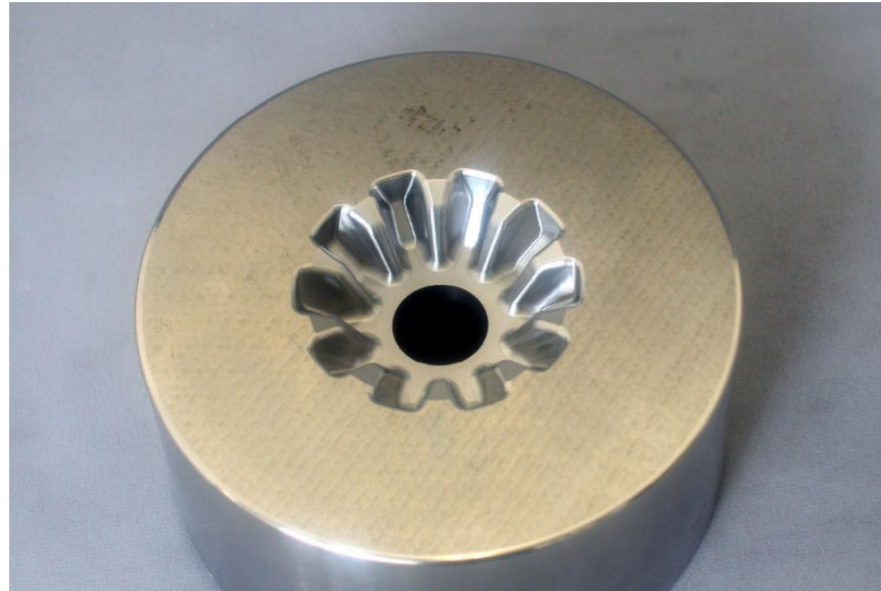
Work piece :Bevel Gear Die Material :SKD11(HRC60) Dimension :Dia100*50(mm) Cutting tool :Carbide endmill & CBN endmill Cutting oil :Oil mist Cutting time : 3hrs 51min